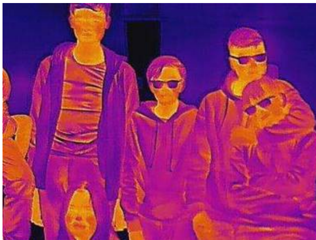
Obrázek 3 Termovize, žáci 8. třídy

Na obrázku 3 vám představujeme některé žáky 8. třídy i s velikostí jejich vnitřní energie.