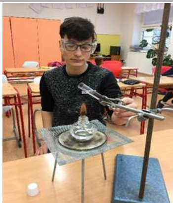
Obrázek 1 Pokus šíření tepla ve vodě

V rámci předmětu fyziky se žáci osmé třídy nejen teoreticky, ale i prakticky seznámili s tématem „Vnitřní energie a teplo“.