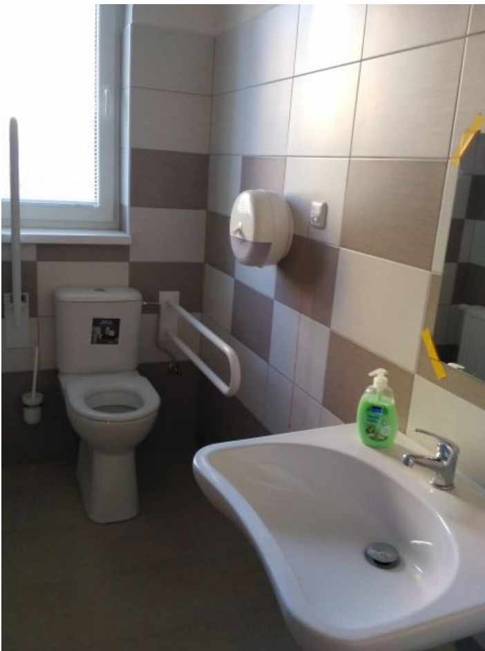
Bezbariérové WC u tělocvičny