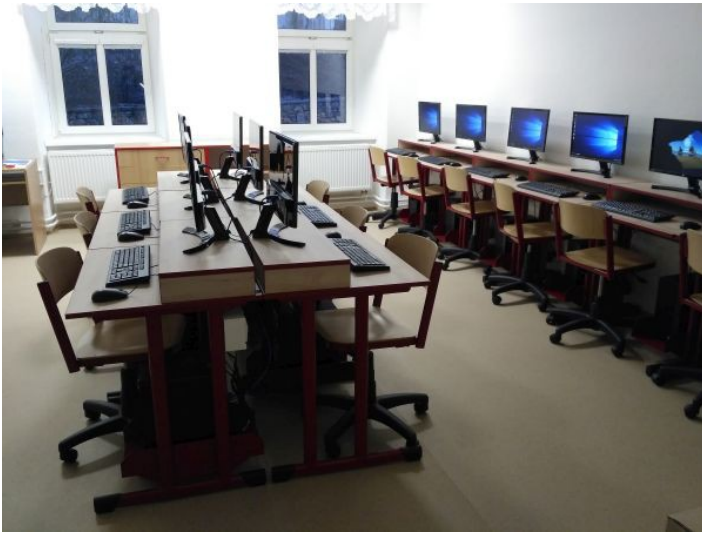
Nové vybavení učebny výpočetní techniky