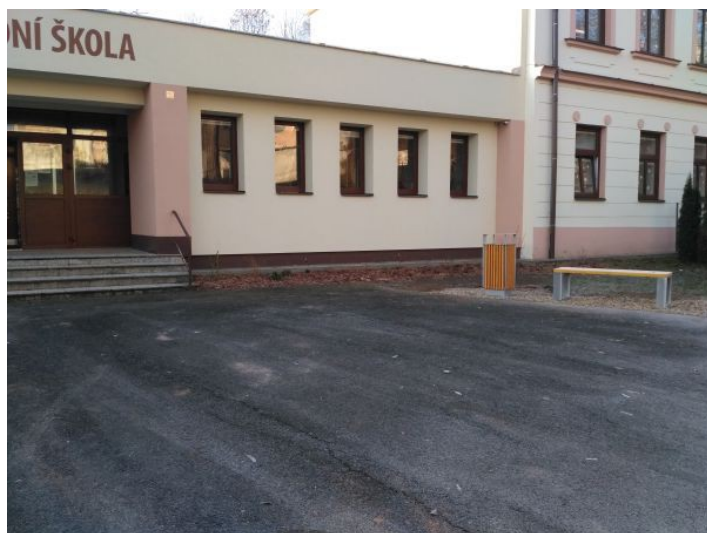
Úprava vchodu před školou