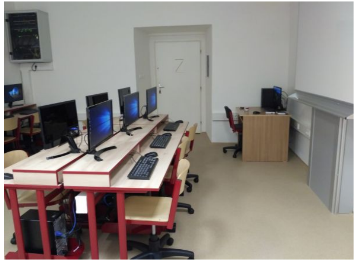
Nové vybavení učebny výpočetní techniky