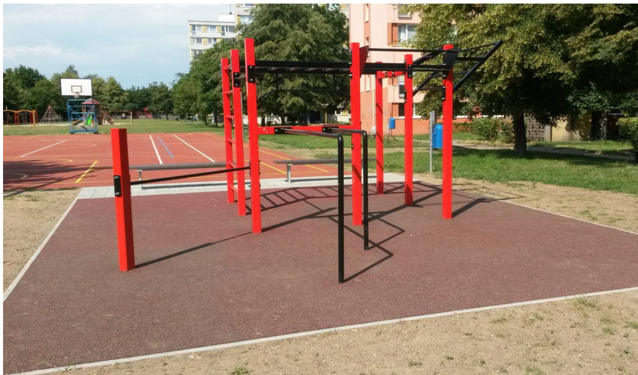
Příklad workoutového hřiště