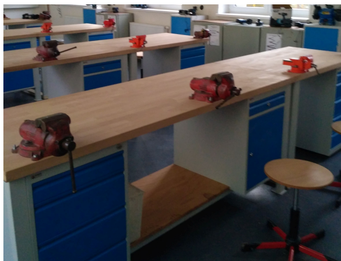
Nové vybavení dílen