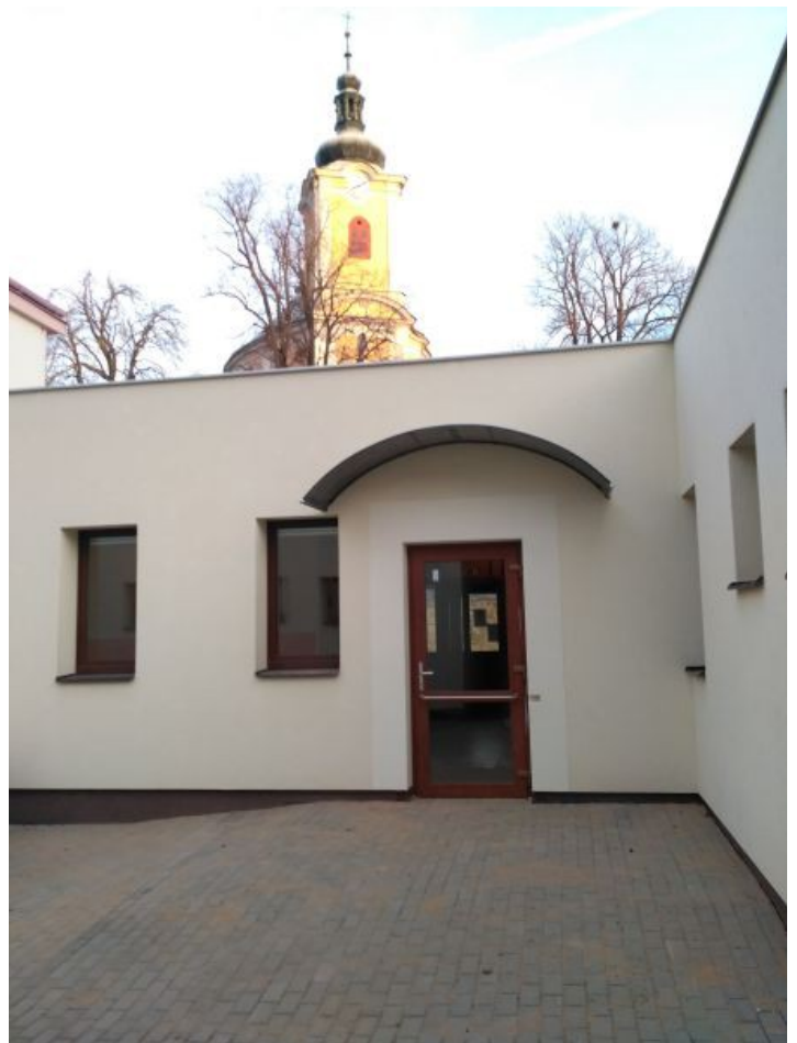
Bezbariérový vstup ze dvora